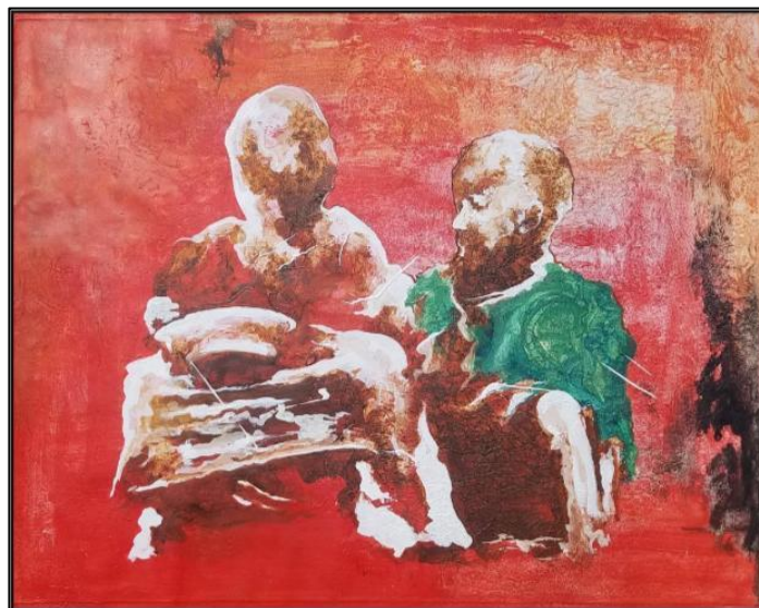
Fig. 2 La famine comme une préoccupation

Technique : Sève d'écorces + peinture acrylique sur toile