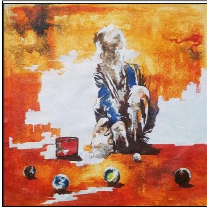
Fig.4 Le jeu de bille

Technique : Sève d'écorces + peinture acrylique sur toile