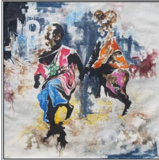
Fig.3 Moment de loisir

L'urgence signalée soutient que la question soit traitée avec diligence, car cette situation dégradante n'honore pas la condition humaine et ce sont les enfants qui en subissent prioritairement les conséquences.